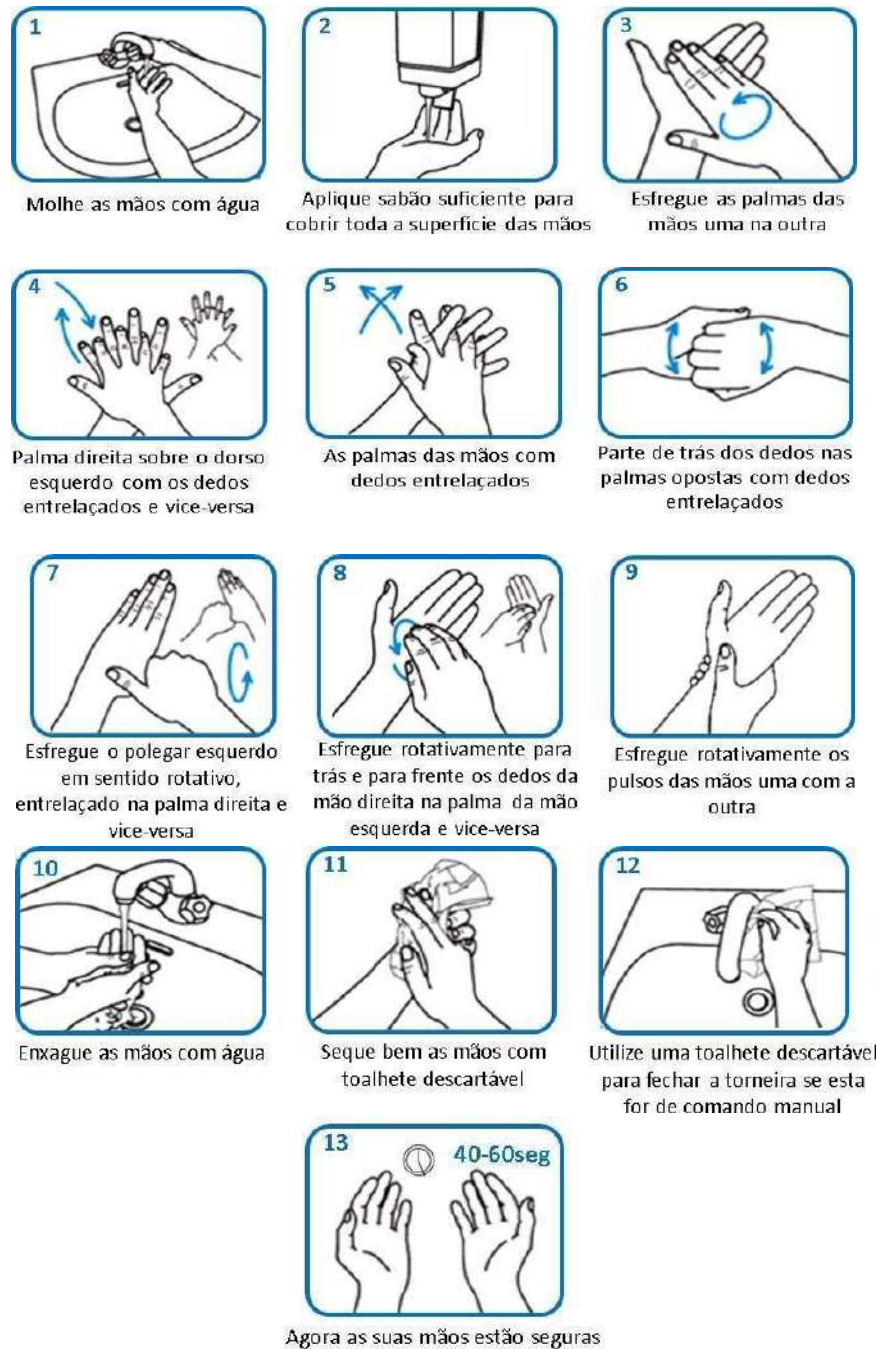
Figura 1 – Etapas para higienização das mãos com água e sabão.