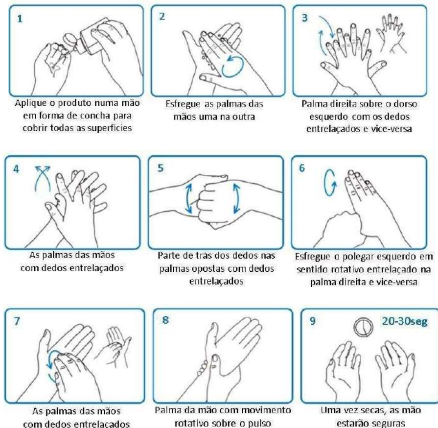
Figura 2 – Etapas para higienização das mãos com álcool a 70%.

OBSERVAÇÕES: A duração de todo o procedimento é de 20-30 segundos; para o benefício do uso de álcool a 70%, não pode haver presença de sujidade visível nas mãos.