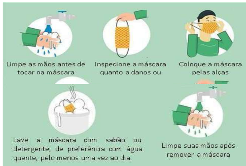
Figura 3 – Procedimentos para utilização das máscaras de tecidos.